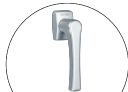
L型インナーハンドル L-Shaped Inner Handle A-394-H 130ページ