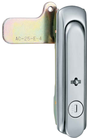
A-464-2-1封印付 With sealing