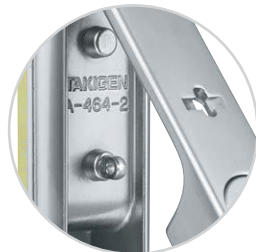
封印用穴 Sealing hole