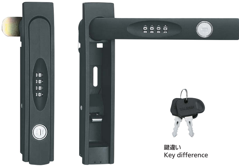
鍵違い Key difference