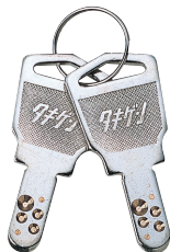
キーNo. D001 Key