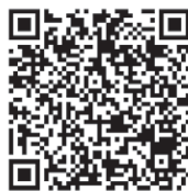
CP-660-A (フラットタイプ) (Flat type)