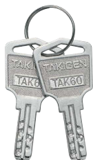
キーNo. TAK60 Key