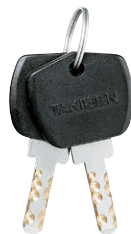
鍵違い Key differences