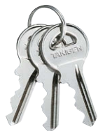
鍵違い Key differences