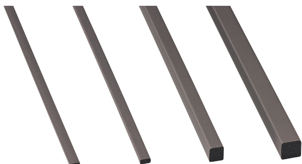
C-300N-B-1-10-EMC C-300N-B-3-10-EMC C-300N-B-10-10-EMC C-300N-B-15-25-EMC