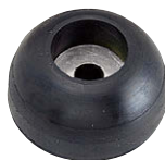
C-30-RK-3617-EP-UL-Black (※1) ブラック