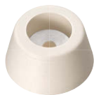
C-30-RK-34-EP-UL-Ivory (2.5Y9/1相当色) アイボリー