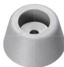
特注 (Gray) グレー