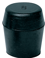
標準色は黒です。 Standard color: Black