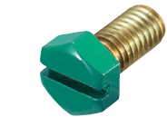
C-209-M6×15 〔マイナスタイプ〕 Standard-head screw