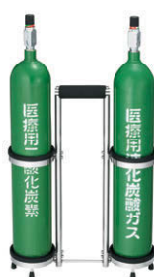
液化炭酸ガスボンベ Liquefied carbon dioxide cylinders