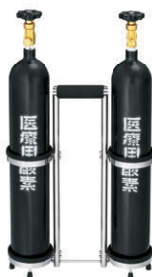
酸素ボンベ Oxygen cylinders