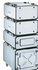
運搬時 For transport