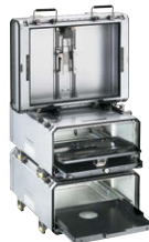
設置時 For setup

Provides storage for a variety of equipment with the same specifications. Can be stacked and fastened, allowing smooth handling from transport to setup. Freely customizable to any size. Contact us for details.